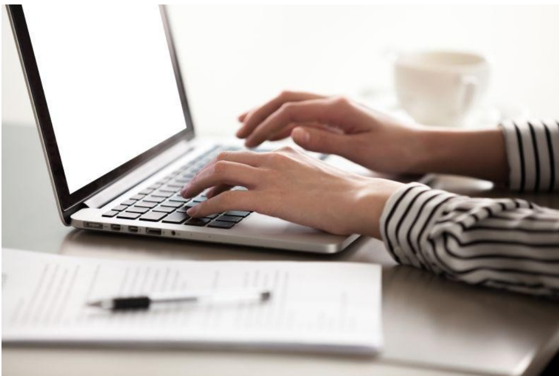
Kuva: Tietokoneen ääressä