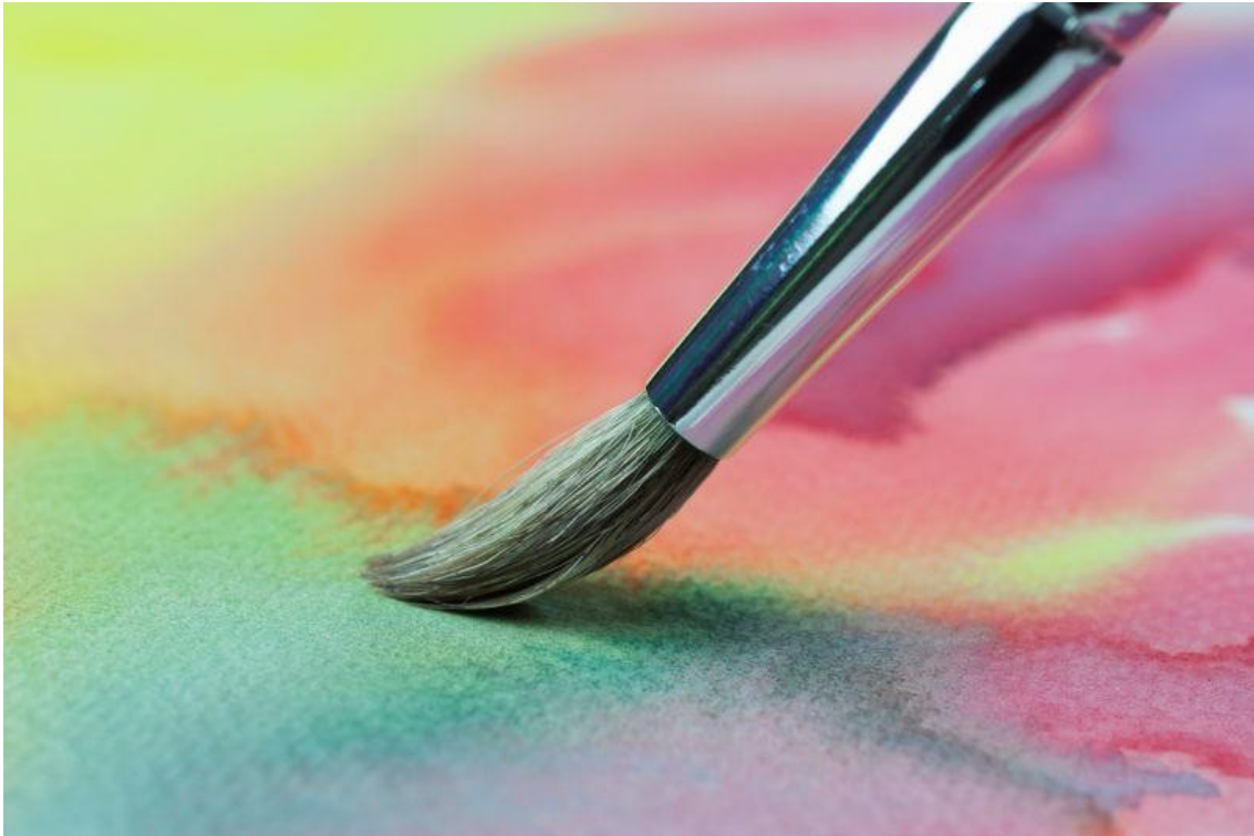
Kuva: Siveltimen jälkeä